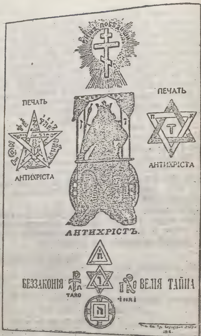
Coperta ediției rusești din 1912 a „Protocoloalelor“.

Ce lucru a finit în frâu fiarele sălbatice care se numesc oameni? Ce i-a călăuzit până acum? La începutul orânduirii sociale ei s'au supus puterii oarbe a pumnului, mai târziu apoi